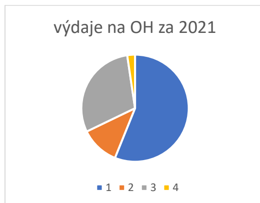
Graf č. 2: Výdaje na OH v roce 2021

Celkové příjmy v roce 2021 činily 1 085 181 Kč. Příjmy z plateb za nakládání s odpady od občanů dosahovaly výše 797 499 Kč (73,5 % celkových příjmů), bonusy od společnosti EKO-KOM za zajištění sběrné sítě pro SEPAR odpady činily 287 682 Kč (26,5 % celkových příjmů).