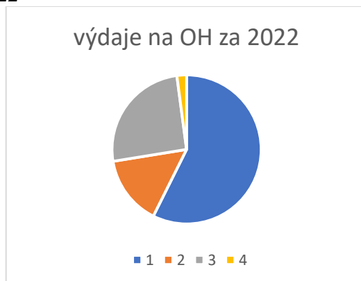
Graf č. 2: Výdaje na OH v roce 2022

Oproti roku 2021 se finanční náklady zvýšily zejména z důvodu dražších služeb svozových firem (pohonné hmoty navýšení)