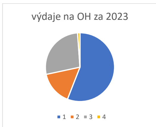
Graf č. 2: Výdaje na OH v roce 2023

Oproti roku 2022 se finanční náklady zvýšily zejména z důvodu dražších služeb svozových firem ( pohonné hmoty navýšení)